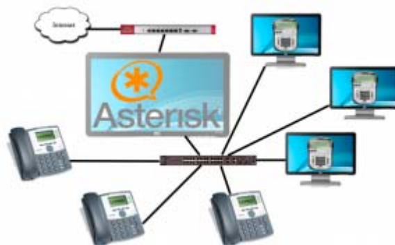
Obr. 2. Topológia VOIP

Taktiež funkčnosť SIP protokolu je dosť závislá na počte routerov pozdĺž cesty, kde sa preukazuje jeho hlavná nevýhoda a to je využitie rôznych portov pre signalizáciu a samotný prenos dát. Pri požiadavke zákazníka alebo inom dôvode zapojenia cez viacero routerov doporučujem použiť IAX protokol, nakoľko v jeho prípade nám Unifikácia signalizácie a zvuku zabezpečuje transparentné prechádzanie NAT-kom a pre použitie IAX protokolu cez firewall je administrátorom potrebné otvoriť jediný port 4569. Aj z tohoto dôvodu klient IAX nepotrebuje vedieť vôbec nič o sieti v ktorej sa nachádza. Z tohoto je jasné, že nemôže nastať situácia, kde sa dokáže spojiť hovor ale bez zvuku.